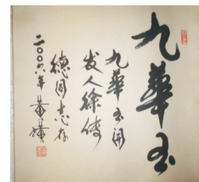
原安徽省委书记黄璜为九华玉题签

但是，就在他们办厂做成玉雕的时候，大家都说安徽无玉。同伙也打退堂鼓，最后闹到了散伙的地步，他则选择坚持。有一天，他去上海，在书店看到一本说玉的书，看到了葛洪关于九华玉的记载，他的内心狂跳不已，这坚定了他要把九华玉推向世界的决心。