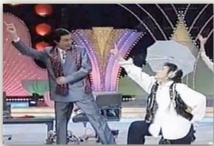
赵丽蓉老师生前小品《如此包装》被网友戏称是“航母Style”的原创