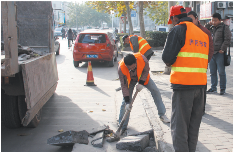
昨天,合肥市庐阳区城管执法大队,对颖上路等12处路段擅自设置的斜坡“便道”进行清理。按照相关规定,对这些违规侵占、损坏城市道路的,可给予100元以上500元以下的罚款。 倪浩 广跃 记者 徐涛 文/图

据悉,肥西县大力实施“工业强县、特色富民、城镇带动、生态立县”战略,闯出了一条具有肥西特色的“崛起之路”,从第一届全国第636位,上升至全国百强县第89位。