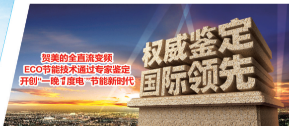
12月6日,美的全直流变频空调ECO节能技术,被以中科院院士领衔的专家组一致鉴定为“国际领先”,该技术鉴定结果为最高级别,开创“一晚1度电”节能新时代。