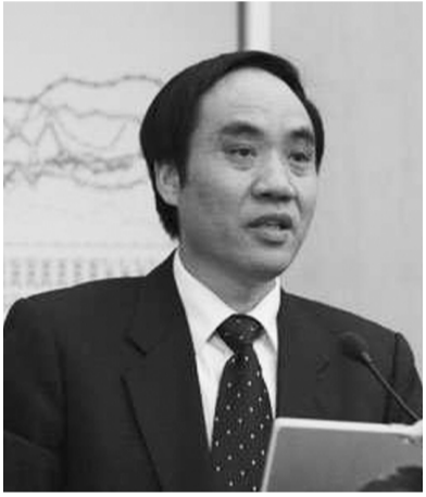
全国人大常委会、民建中央副主席 辜胜阻

2012年召开的“十八大”开启了新政治周期。和新政治周期相适应的新经济周期的突破口在哪儿？我认为是新型城镇化。我们的股市需要“阳光”，这个“阳光”，我觉得就是新型城镇化。