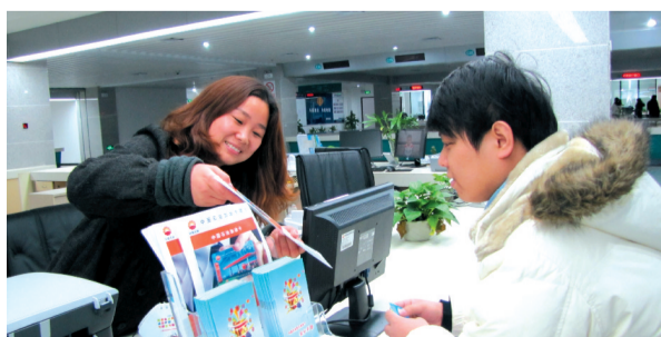
新年伊始,中国石油滁州分公司客户服务中心窗口在滁州市行政服务大厅正式投入使用。窗口集加油卡办理、储值、积分查询和油品直销等为一体,为客户提供“一站式”服务,不仅方便了客户,提高了服务效率,也成为公司展示企业形象、宣传业务的窗口。 张春雨 陶杰

肥市糖业烟酒有限责任公司; 连锁超市企业:安庆市世纪华联超市有限公司、安徽徽商红府连锁超市有限责任公司、北京华联超市安徽分公司; 餐饮连锁企业:合肥蜀王餐饮集团、合肥黄山大厦酒店管理有限公司、安徽古井酒店管理有限公司、安徽惠园酒店股份有限公司、安庆尊悦酒店有限公司; 综合百货单体店:安徽商之都合肥旗舰店、芜湖华亿国际购物中心、安徽阜阳商厦; 信息工作先进单位:安徽商之都股份有限公司、安徽辉隆农资集团、安徽省阜阳商厦股份有限公司。 记者 任金如 丁林