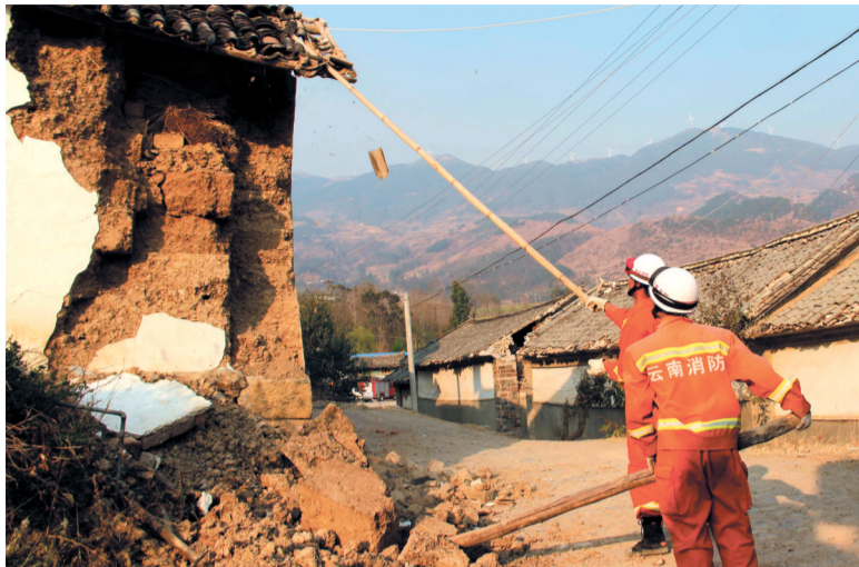
消防官兵在地震灾区救援