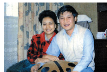
1989年9月，习近平和彭丽媛合影