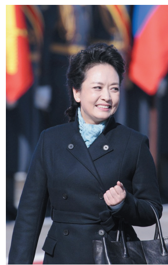
彭丽媛陪同习近平出访俄罗斯

国家主席习近平23日在莫斯科国际关系学院发表重要演讲，阐述中国对当前国际形势的看法、中国的外交方针和发展中俄关系的主张。习近平说，鞋子合不合脚，自己穿着才知道。一个国家的发展道路合不合适，只有这个国家的人民才最有发言权。