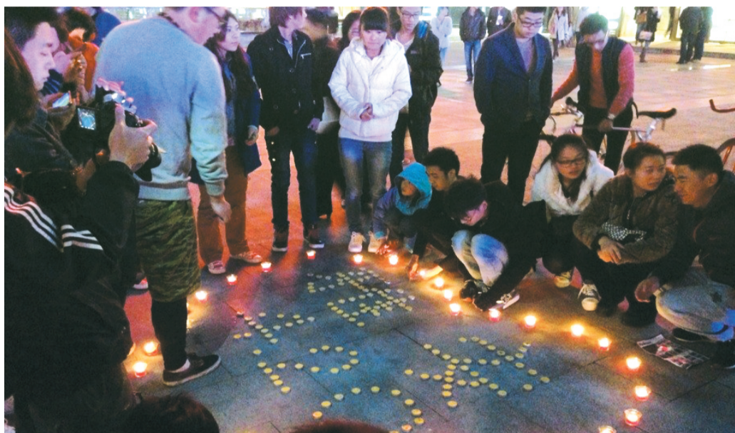
省城之心城广场上,合肥市民自发为雅安祈福。

记者获悉,下午4:50,他们坐上了从南京发往成都的快677次列车,将于21日晚7时到达成都站,然后,再从成都转车赶往芦山县。