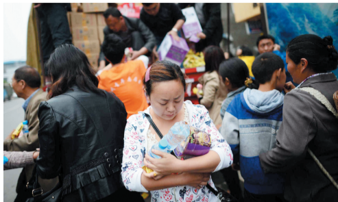
群众在救灾物资发放点领取物资