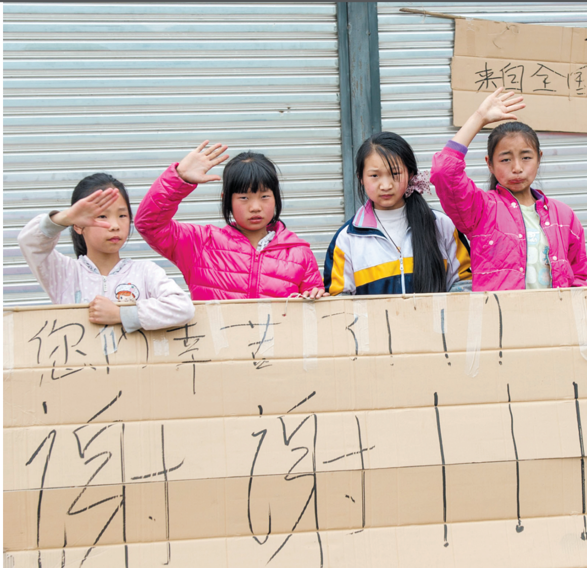
小朋友写下标语并敬礼感谢参与救援的人们