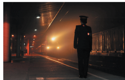
最后一趟列车驶进火车站