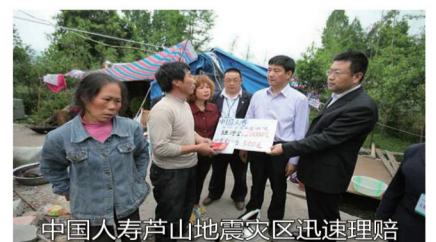
中国人寿芦山地震灾区迅速理赔

重视,第一时间要求四川省分公司迅速组织队伍,实地查看灾情,做好理赔工作。中国人寿四川省分公司负责人近日向媒体表示,受中国人寿董事长杨明生和公司总裁万峰的委托,中国人寿将向雅安灾区捐赠人民币1000万元,中国人寿慈善基金会全面助养本次因地震不幸失去双亲的孤儿,负担每月每人600元的基本生活费用,直至年满十八周岁。同时,还明确宣布,将向参与救援的新闻工作者、医护人员和公安民警捐赠每人20万元人身意外伤害保障,捐赠对象包括解放军指战员和武警官兵。