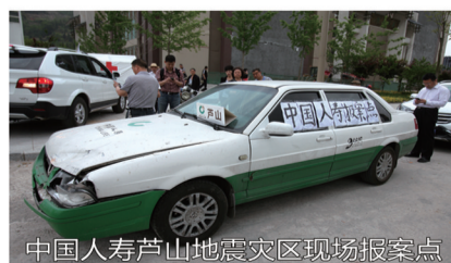
中国人寿芦山地震灾区现场报案点

安徽国寿也迅速反应,立即制订并下发了《“4.20芦山地震”安徽国寿理赔服务指南》。明确规定:一是24小时受理客户报案和值班轮守制度,及时做好报案登记;二是实时与中国人寿四川省分公司保持联系,第一时间对4.20芦山地震中死伤人员名单信息进行核查,一旦确认系我省客户立即通知保单承保单位;三是各承保单位在接到我省客户出险信息后,