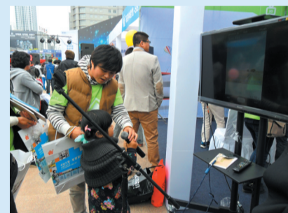
高清馆花絮：“我来唱儿歌给你们听”