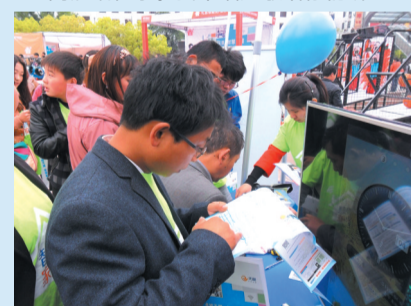
查地图看看哪些加油站可以用翼支付