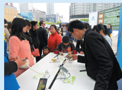
在高速馆体验热门手机