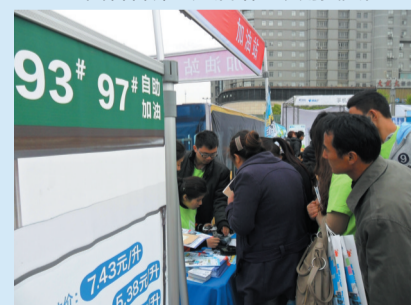
智能馆加油站内市民等待体验翼支付功能