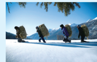
关爱自然、关爱动物,更不失为慈善之举。日前,新疆喀纳斯景区野生动物保护中心工作人员乘坐马拉爬犁先后前往喀纳斯湖一道湾、点将台、月亮湾三个区域进行多点人工投放饲草行动,该行动将持续15天。由于积雪较深饲草全部由工作人员背到投放点。据观测,在点将台投放点有两只阿尔泰山马鹿前来觅食,在月亮湾投放点留下了原麝觅食的痕迹。