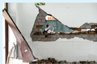
2013年4月21日,四川省雅安市宝兴县灵关镇灵关中学教室在地震中受损严重,多方伸出援手。