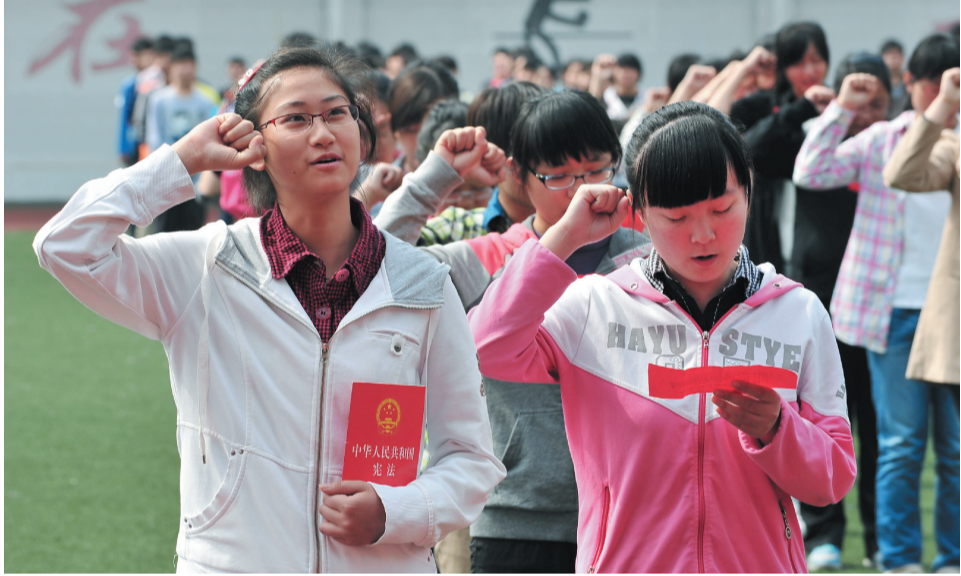
5月3日,合肥市七中,高三年级的学生走过“成人门”,手捧中华人民共和国宪法宣誓“我已成人”。大家纷纷表示从此要做一个担当家庭与社会责任的成年人。

父母含泪给孩子穿上一套新衣服后,再也无法抑制悲痛情绪,一度瘫倒在地。 这是一个很甜蜜的三口之家,夫妇俩从老家庐江来到合肥,四处打工为生。小磊则就读附近一所小学,在父母眼中,孩子虽有些调皮,但能听话。 平常下午放学后,小磊去辅导班老师那里“报到”,督促完成布置的家庭作业后回家。 当日下午,还在各自岗位上忙碌的这对夫妇,在接到警方的这通电话后,原本洋溢在这个家庭里圆满的快乐,永远地消失了。 程誉 星级记者 张敏