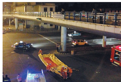
民警紧急铺设消防气垫