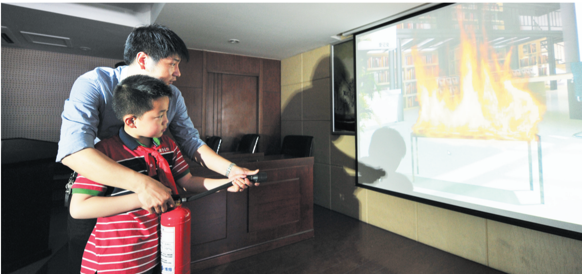
昨日下午,庐阳区三孝口街道杏花社区的“消防体验馆”首次开放,来自于淮河路第三小学的小学生们体验了一把灭火经历。“消防体验馆”是一处集消防器材设备展示、模拟演练、实地训练、消防培训等于一体的多功能综合性消防培训体验场所。从即日起,该体验馆正常工作日开放,社区居民可以参观体验学习。

作为省属大型国有旅游企业,安徽省旅游集团曾先后多次组织赴贫困老区“捐资助学、帮扶结对、送医送药”活动。“即将登场的5.19‘中国好人’公益旅游活动,是省旅游集团感恩回馈社会的一次升华,我们也愿意将这份正能量继续传递下去,继续给‘好人们’送旅游福利。”该集团负责人告诉记者。