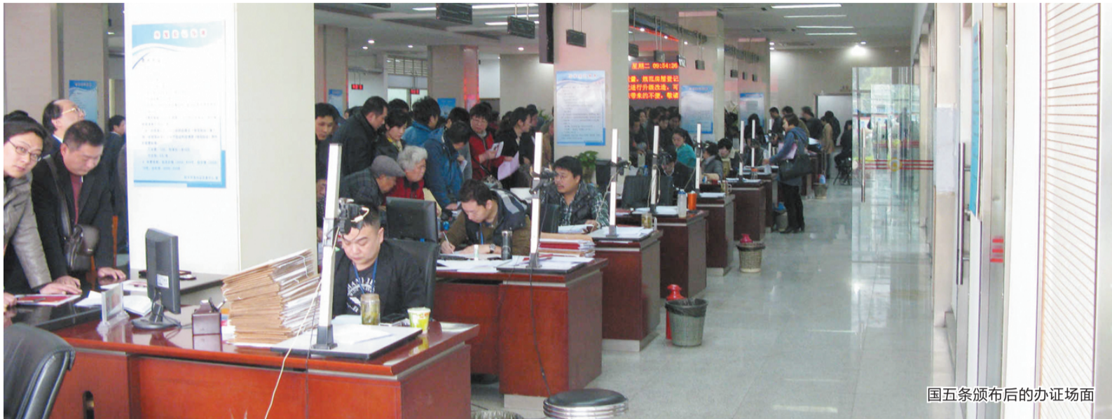
国五条颁布后的办证场面