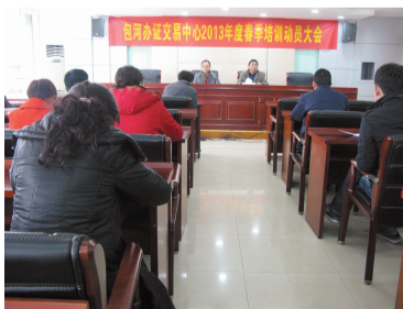
2013年春季培训动员大会