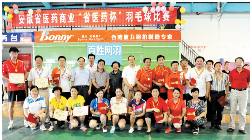
领导、嘉宾与获奖选手合影