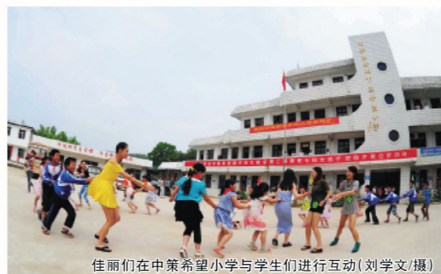
佳丽们在中策希望小学与学生们进行互动