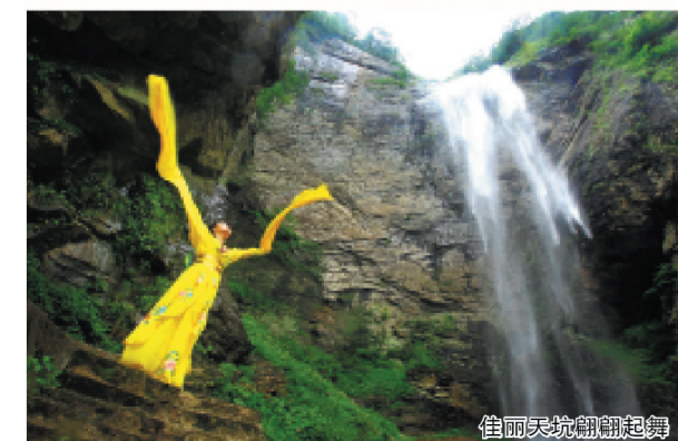
佳丽在天坑翩翩起舞

人与自然和谐的画面。本届大赛21进14环节，不仅有拍摄、才艺比拼活动，21位佳丽还专程赶往中策希望小学与学生们开展了精彩的互动活动，并送去了书籍、文具等爱心礼物。安徽黄梅戏剧院的知名演员们，也应中策投资集团的盛邀，在6月22日晚为燕子河镇及周边村民送去了一台高水平的黄梅戏演出，极大地丰富了当地乡亲们的文化生活。21位佳丽在燕子河大峡谷才艺秀结束不久，“21进14”的网络投票也正式开始啦，21位佳丽你最喜欢哪些，不妨以您的投票，参与这场美丽的盛宴吧！