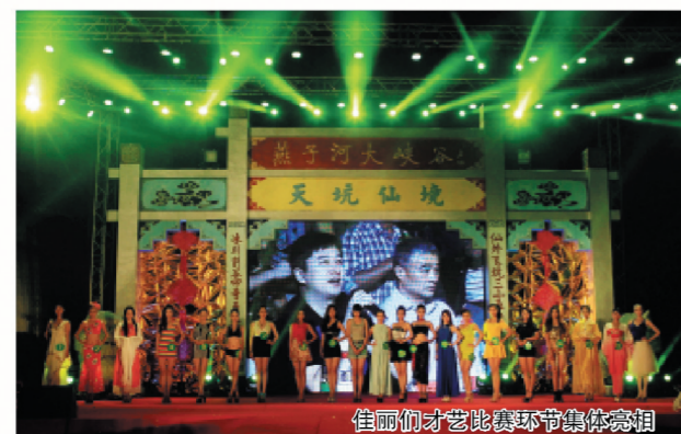
佳丽们才艺比赛环节集体亮相