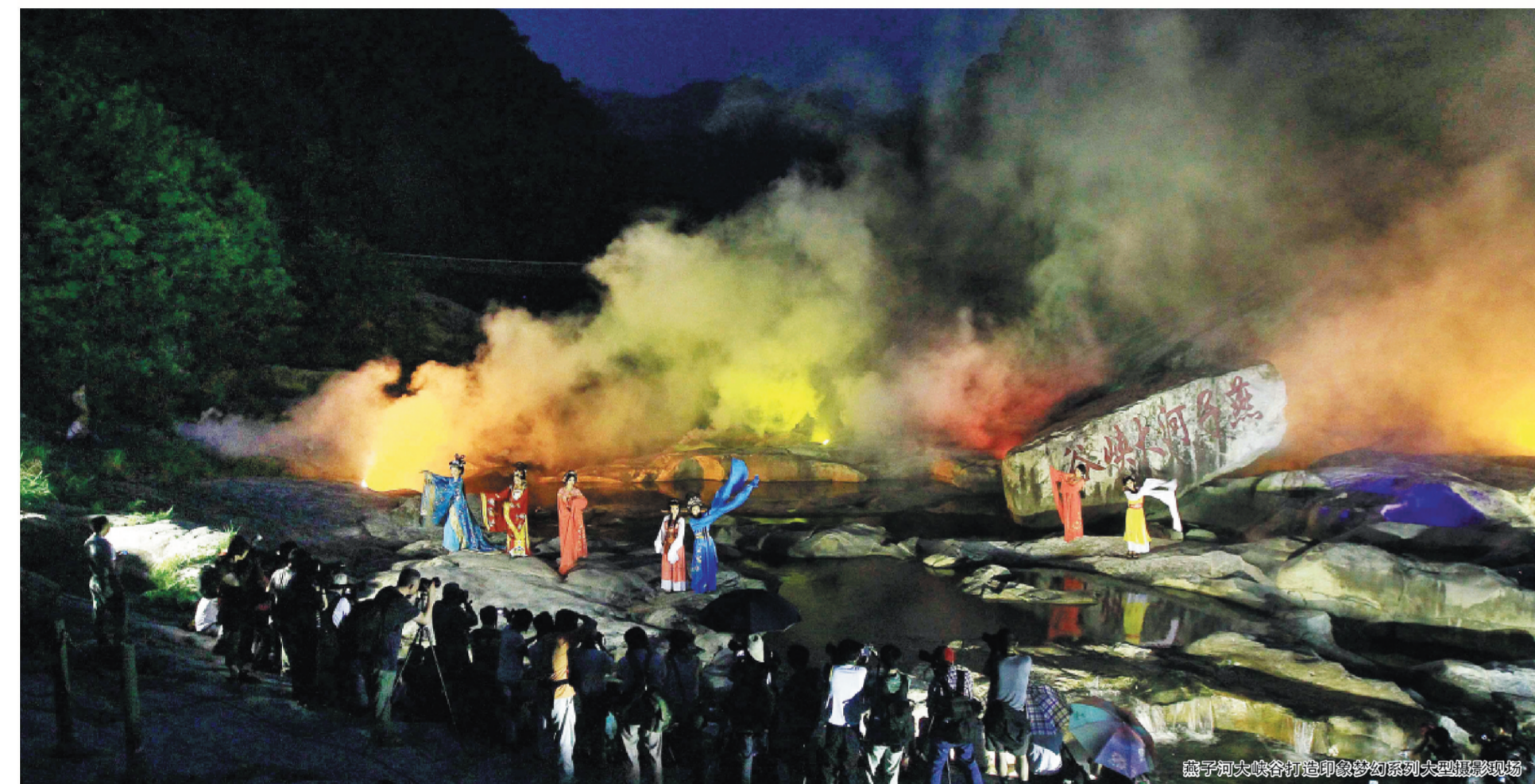
燕子河大峡谷打造梦幻系列大型实景演出

2013第二届燕子河大峡谷 寻找中国最美七仙女 古装泳装模特摄影大赛 主办单位：合肥网 安徽中策投资集团