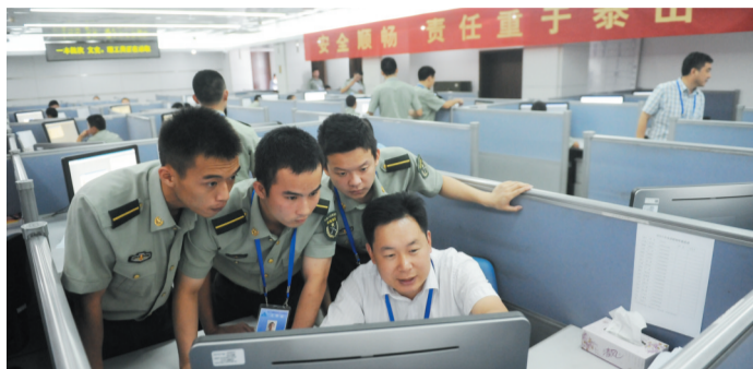
紧张核对考生信息

达线考生从投档到录取要经过哪些程序？要是填报了专业服从又达到了学校最低投档线，能确保被录取吗？……昨天，在我省招生的一本院校进入录取的关键时期，本报记者受省考试院邀请走进录取现场，见证了一名考生从投档到录取的全过程。