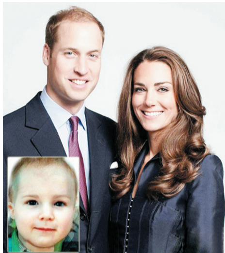
网友根据威廉王子夫妇的相貌特征合成了王室宝宝的相貌照

英国当地时间7月22日下午4点24分（北京时间7月23日零点24分），凯特王妃在经历了约11个小时的顺产过程后，在伦敦圣玛丽医院诞下一名8磅6盎司（合3.8公斤）重的男婴。白金汉宫随后宣布，小王子的封号为“剑桥王子”，他是继查尔斯王储、威廉王子之后英国王室第三顺位继承人。这是100多年来英国王室首次出现君主和准君主“四世同堂”。