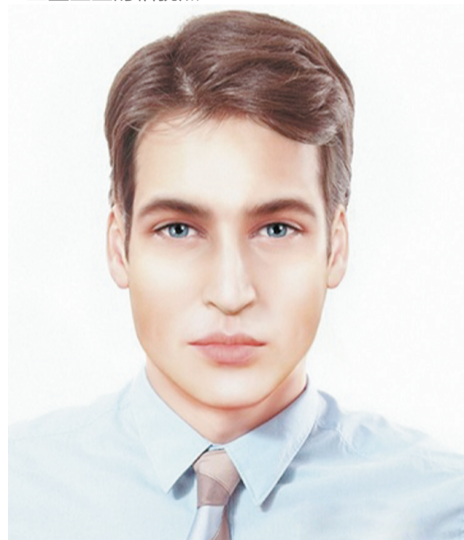
设计师预测的皇室宝宝成年以后的样子