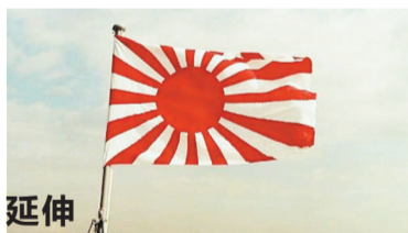
延伸 日将认定“旭日旗”为国旗

1943年底从中国返回日本国内，此后作为海军院校的练习舰使用。1945年7月24日在美军的吴港轰炸遭到3枚炸弹击中，翻覆沉没。