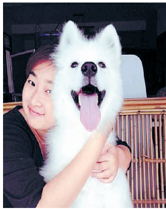
网友@卢SS和“台长”已形影不离

很巧的是,@卢SS在回家路上发现了这只瘦弱的小萨摩耶!“它瘦到宠物医院的人都很吃惊!”@卢SS心疼