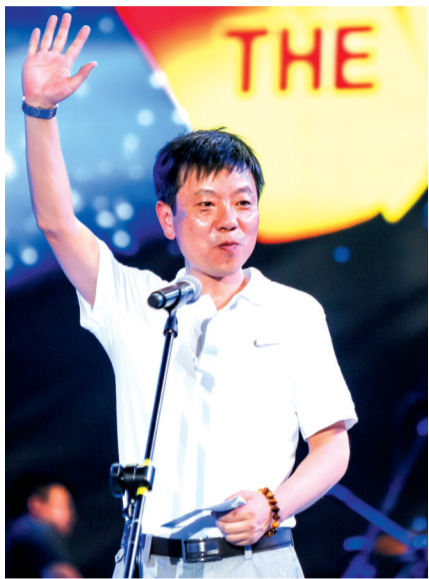
潘总在演唱会现场致辞