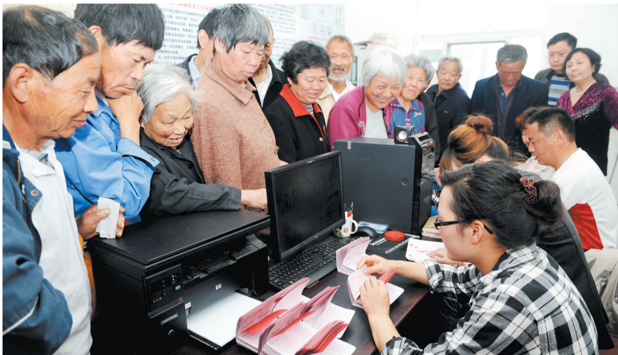
淮南大通区洛河镇淮建村1000余名被征地农民每人每月领取260元养老金

2013年是落实十八大战略部署的开局之年，也是实施“十二五”规划承前启后的关键一年。淮南市集全市之力，在推进民生工程实施上交出了一份靓丽的答卷。今年35项民生工程将投入20.2亿元，同比增长25.5%；截至6月底，该市已到位民生工程资金15.38亿元，占全年民生工程资金76%。