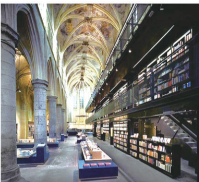
马斯特里赫特 教堂书店

有着800多年历史的多米尼加教堂改造的书店,有该市内最多的英文藏书,是一个集咖啡馆和阅读于一身的休闲场所。建筑师利用教堂的巨大空间,装上了一个三层楼高的巨型黑色钢制书架,从地面一直延伸到教堂顶部的石拱处。穿行在一排排书架间,不时仰望一下教堂高大美丽的穹顶,让人有种远离尘嚣、宁静致远的感觉。