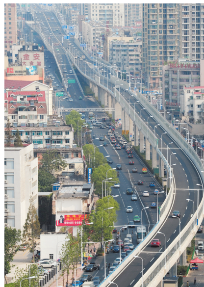
阜高架昨天正式放行