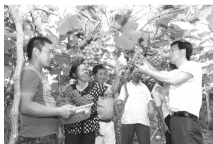
新型农民培训硕果