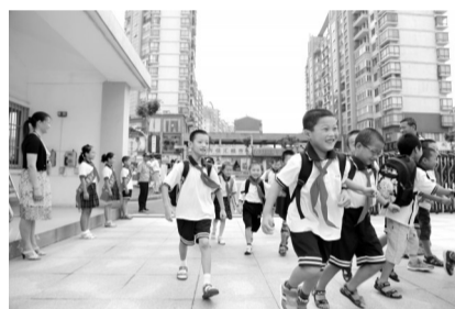
城乡义务教育惠及广大中小學生