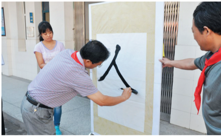
合肥市滁州路小学校长为师生写“人”字