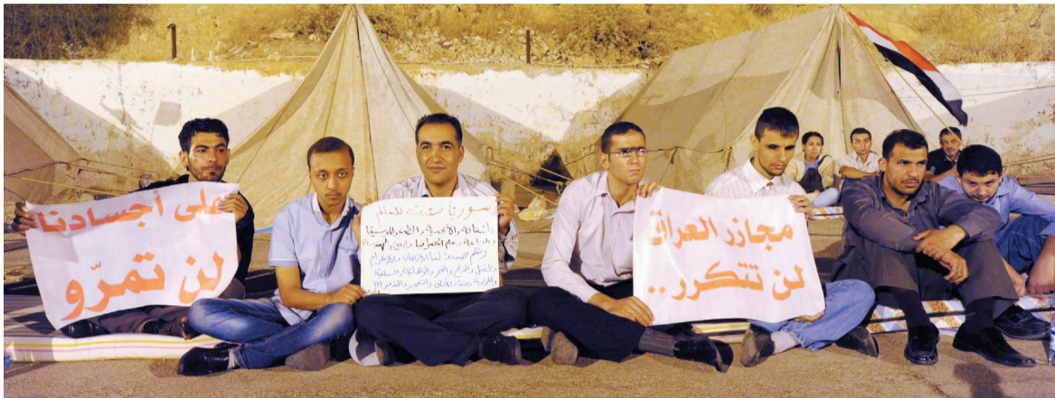
叙利亚青年组“人盾”反对美国动武

叙利亚外长穆阿利姆10日表示，叙利亚“已经同意”了俄罗斯提出的叙交出化学武器交由国际监管的提议。穆阿利姆在莫斯科与俄罗斯下议院议长会谈后说，9日，叙利亚方面与俄罗斯外长拉夫罗夫举行了一轮非常富有成果的谈判，拉夫罗夫提出了有关化学武器的提议。