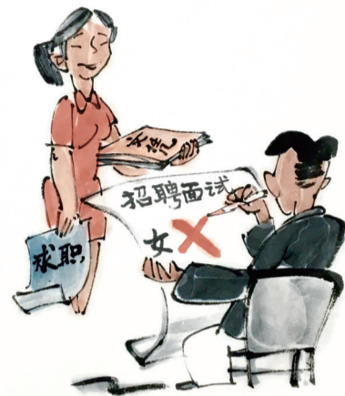
先天不足 王恒/漫画

生育行为本应为全社会所关注和支持。事实上有不少国家意识到解决女性工作和育儿家庭责任之间冲突的重要性,采取了多种措施。比如新西兰带薪产假中的“薪”是由政府发放;俄罗斯产妇产假