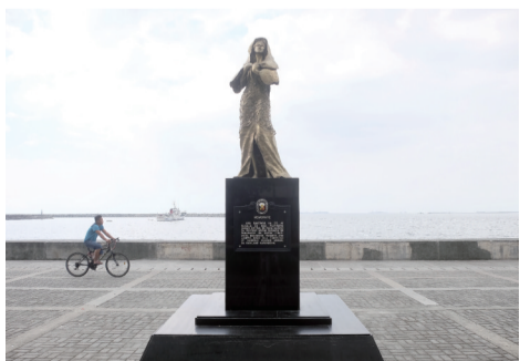
位于马尼拉湾的菲律宾首座“慰安妇”纪念雕像提醒着人们不要忘记那段历史

在第二次世界大战后的上世纪50年代至70年代之间，菲律宾与日本、缅甸同属亚洲最富国之一，也是新兴工业国家及世界的新兴市场之一。那段时期以后，菲律宾高速发展，马尼拉作为菲律宾首都及第一大城市，成为全世界最具国际化的城市之一，同时也是全世界最多元化的城市之一，被人们称为“亚洲的纽约”。