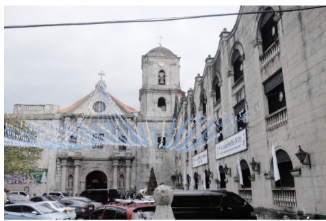
圣奥古斯丁教堂建于1599年，是菲律宾历史最悠久的石头建筑