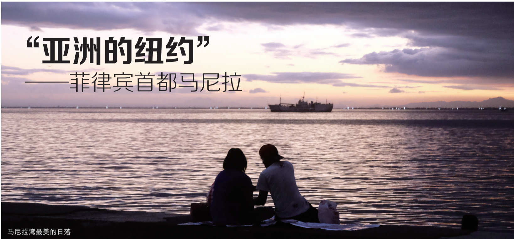
马尼拉湾最美的日落