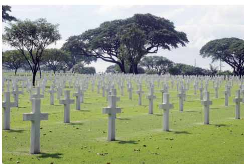
马尼拉美军纪念公墓是世界上最大的为纪念在二战太平洋战役中阵亡的美军以及其他盟国的战士的墓