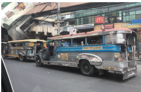
吉普尼是菲律宾特有的交通工具，由二战时期美国留下的吉普车改装，遍地都是