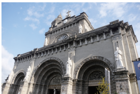
马尼拉大教堂是马尼拉天主教大主教管区的主要建筑