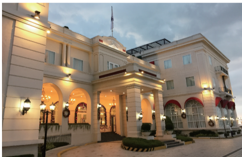
有着106年历史的“美国陆军海军俱乐部”曾经被评价是“世界上最好的军队俱乐部”，如今被改造成酒店