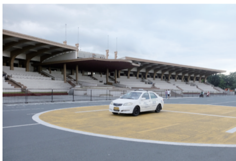
2010年菲律宾人质事件的发生地基利诺大看台，那次事件中8名香港同胞身亡，6人受伤，震惊世界