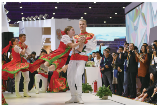
来自俄罗斯的舞蹈展示