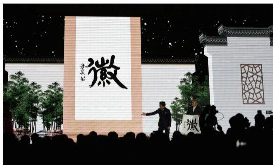
安徽文化旅游展示——文房四宝