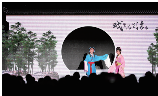
安徽文化旅游展示——黄梅戏

203家安徽的企业展商,“在纺织品展会,我们也获得了127家区内企业到场参展。可见在经济建设、技术创新和推动国际贸易的不懈努力下,安徽已成为法兰克福展览集团最重要、最关键的市场之一。”