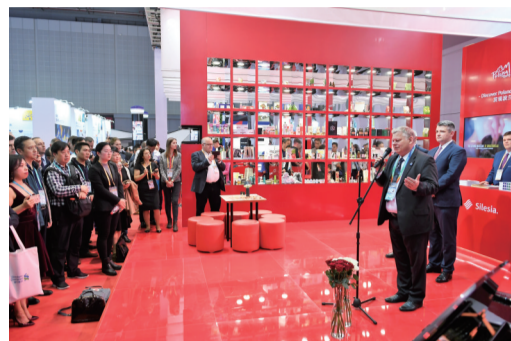
波兰国家馆开馆仪式现场

星报讯(特派记者 汪婷婷/文) 昨日,位于上海国家会展中心的进博会各大展馆人气高涨,中外客商、参展商、采购商纷至沓来。尽管7大展馆有各色亮眼的明星产品,但是,进博会上人气最旺的还要数国家馆。在这里,共有82个国家、3个国际组织设立了71个展台。逛一圈展,相当于走遍了天下。