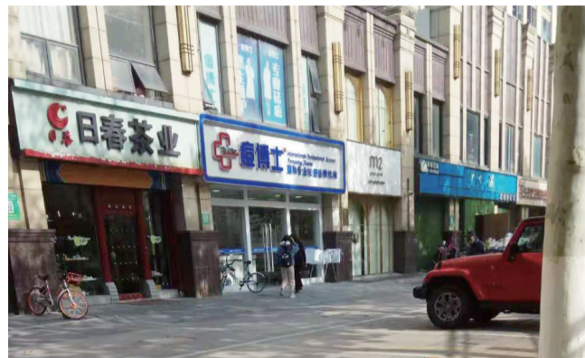
芜湖路上的痘博士店

“分期所产生的利息由顾客自行承担。”记者留意到,在分期协议中,明文标注分期利息是由顾客自行承担。