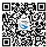
掌中安徽 微信二维码