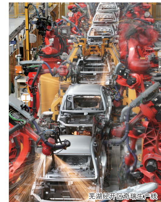
芜湖经开区奇瑞生产线

淮南经开区从上一年度的全国185名一跃到如今的全国137名。对此，卢宏世给予高度评价。“开发区的工作是拼出来的，在这场全国经开区综合发展大PK的过程中，淮南经开区进步近50名，可谓是‘最佳进步奖’的典范。”他说。