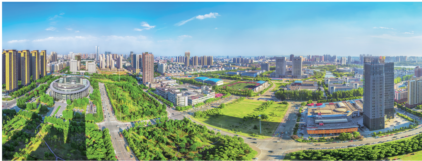
合肥经开区：规划引领，推动城市国际化