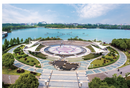
合肥经开区翡翠湖

陈俊说，作为全国首批“国家新型工业化家电示范基地”，合肥经开区云集了海尔、美的、长虹、美菱、晶弘等国内外知名家电品牌生产厂家以及众多配套企业。“中国家电第一区”的称号实至名归。 经开区电子信息产业的迅猛发展，得益于联宝电子、宝龙达信息公司等龙头企业的强力拉动。仅联宝、宝龙达两家企业量产产后，笔记本电脑年产量将突破3000万台。以联想为代表的全球最大笔记本电脑生产基地正在合肥经开区加速崛起。