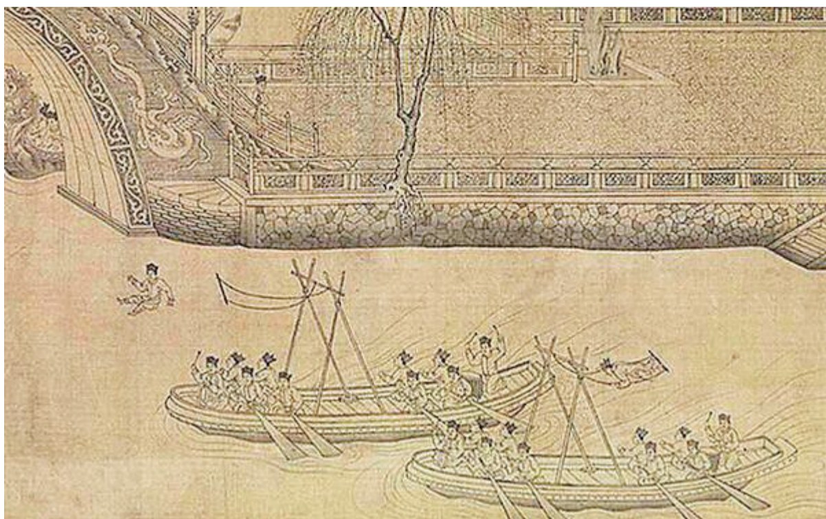
元代王振鹏所绘《龙池竞渡图》中的“水秋千”

日前,第十八届世界游泳锦标赛在韩国光州落幕。中国队收获16枚金牌、11枚银牌、3枚铜牌,位列金牌榜第一。精彩的游泳比赛为炎热的夏日带来了一丝清凉,也瞬间打通了青年君的“脑回路”:我国是世界上最早开展游泳运动的国家之一,公元前6世纪左右,《诗经》《国风·邶风·谷风》篇就有“就其深矣,方之舟之;就其浅矣,泳之游之”的记载。不过,游泳并不完全像今天一样,为了强身健体、为国争光,而是根据不同的现实需要,被广泛地运用在军事、生产生活以及娱乐等社会生活的各个方面。今天,就来聊聊古代游泳那些事儿。 □ 人民