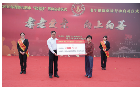
中国人寿安徽省分公司200万元支持老年春晚

争做“尊老敬老爱老助老”志愿者。“老吾老以及人之老”。关爱老人的今天，就是关爱自己的明天。让我们积极参与到为老志愿服务中来，以创建“敬老文明号”为载体，规范为老服务水平，创新为老服务环境，以老年人满意为目标，立足本职，真情服务。“众人拾柴火焰高”。让我们携起手来，弘扬尊老、敬老、爱老、助老的传统美德，用实际行动尽一份孝心，献一片爱心，为建设现代化五大发展美好安徽作出自己应有的贡献。