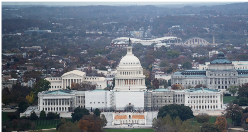
位于美国首都华盛顿的国会大厦(资料图片)。